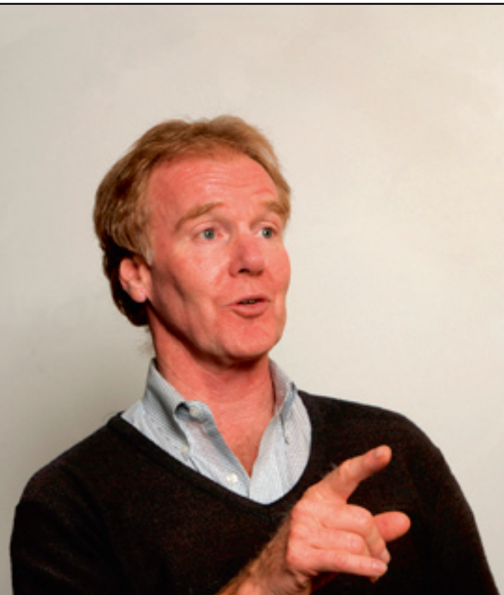
Peter Senge: 'Niets doen is geen optie'

behandelt. De delen die ingaan op het systeemdenken en samenwerking zijn rijkelijk voorzien van hulpmiddelen. De tips om effectievere gesprekken te voeren met externe en interne partijen bijvoorbeeld zijn uitermate toepasbaar en het proberen zeker waard. De jus zit in de laatste paar delen van het boek. Daarin staan innovatie, creatie, de toekomst en leiderschap centraal.